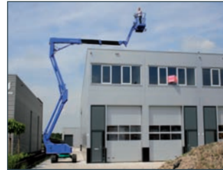
Prima inzetbaar in nauwe doorgangen.