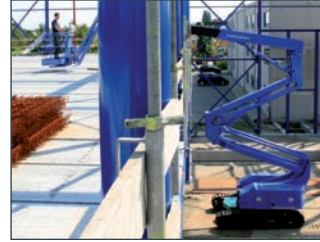
Flexibel inzetbaar door 'Up and Over'-constructie.